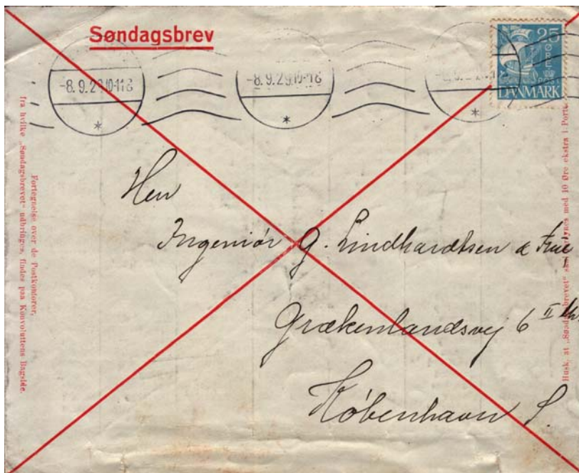
Tillæg for søndagsudbringning: