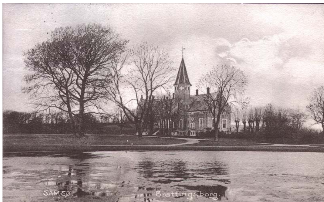
Motiv: Brattingsborg Slot. Kortet er udgivet af R. Kleis' Forlag. Eneret nr.13189