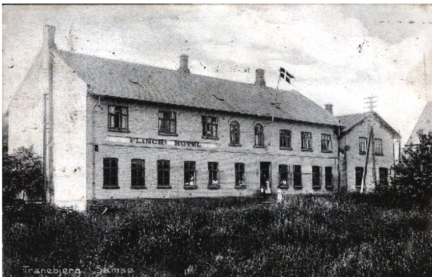
Flinchs Hotel set fra gadesiden ca 1900.